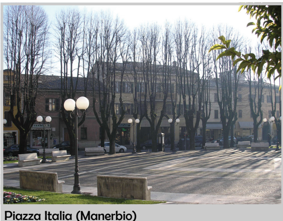
Piazza Italia (Manerbio)

A livello individuale si vigilerà non solo sulla presenza di extracomunitari senza permesso di soggiorno, ma anche su chi assume queste persone o a loro affitta e vende dei locali abitativi. Occorre scoraggiare questo fenomeno interrompendo un reato con la previsione della sanzione prevista dalla Legge. Ultimo ma non meno importante per la sicurezza di ognuno, la decisione di aumentare l'illuminazione pubblica, fondamentale per vederci chiaro, in tutti i sensi.