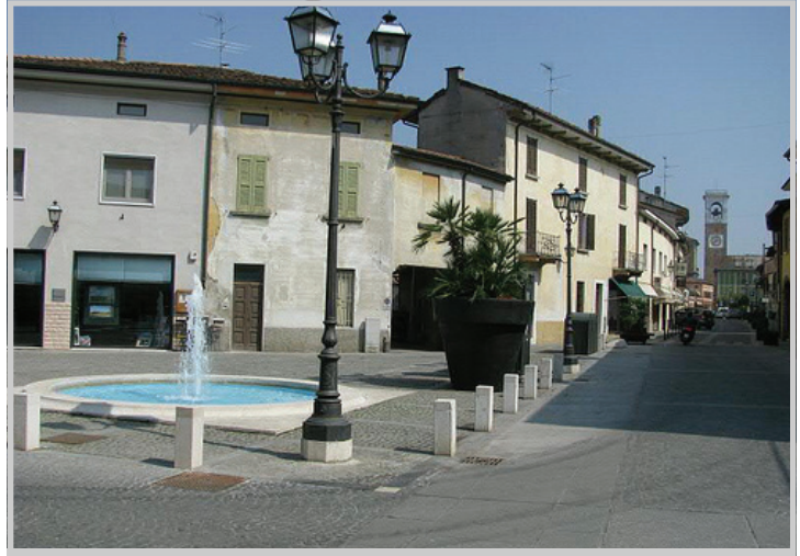
Ingresso di via XX Settembre (Manerbio)

L' "esiguo" numero delle Forze dell'Ordine non può riuscire a sorvegliare tutto e sempre il paese. L'organico esecutivo della nostra Polizia Locale è