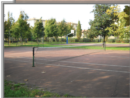
L'intervento di manutenzione ai campi da Tennis presso il Parco Rampini (Manerbio)