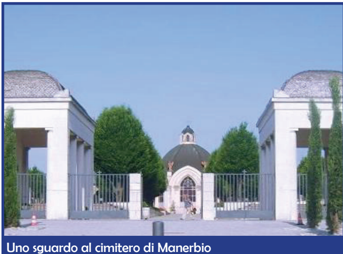
Uno sguardo al cimitero di Manerbio

Vi sono lavori da fare e mancando la copertura di bilancio, nel corrente anno, non possiamo eseguirli e quindi è possibile solo fare alcune manutenzioni su manufatti ed impianti e limitati interventi di stretta necessità per la sicurezza delle persone: tracciamento aree di sosta in Piazza Falcone, staccionate di protezione a fianco dei ponticelli sul ramo del vaso Luzzaga, in via Giovanni XXIII in prossimità dell'incrocio con via Madre