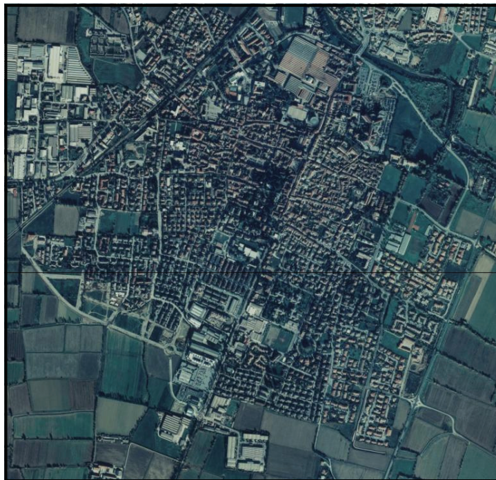
Una fotografia dall'alto del territorio di Manerbio (ortofoto)

La gestione diretta avverrà attraverso la costituzione del "Polo Catastale della Bassa Bresciana Centrale" costituito dai Comuni di Bagnolo Mella, Cigole, Manerbio, Milzano, Offlaga, Ponteviso, Pralboino, Seniga e Verolavecchia.