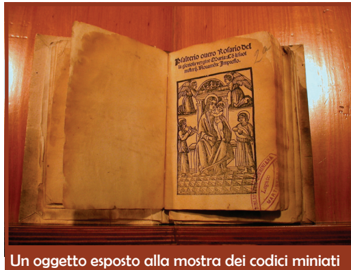
Un oggetto esposto alla mostra dei codici miniati

Analoga finalità avrà la gestione delle Associazioni e degli impianti sportivi, che verranno valorizzati dall'Amministrazione, in base alla qualità del servizio che essi saranno in grado di proporre e concretamente dare ai cittadini, in modo particolare, ai giovani. Già, perché Giovani e Cultura, Giovani e Sport sono binomi importanti, che divengono dunque gli obiettivi dell'Amministrazione. A motivo di ciò, quest'anno, nel Comune di Manerbio, ha avuto spazio pure il corso di Rugby, che da Leno, ha voluto spostare a Manerbio i propri allenamenti e l'affluenza dei ragazzi ha confermato il successo di questa scelta. Ciò è testimone del fatto che il dialogo tra Associazioni Sportive e Assessorato competente, che si prodiga per sostenerle nel loro servizio alla collettività, è assai proficuo. Infine, proprio per valorizzarne al meglio l'attività, si sta cercando di definire la fisionomia delle varie Associazioni, in base alla loro utilità sociale e al loro raggio d'azione. Preziosa, a Manerbio, è la realtà del volontariato, che si traduce in attività benefiche, culturali e sportive, a favore della collettività e che merita la giusta attenzione; per queste ragioni, come già anticipato, in occasione delle festività natalizie, una domenica di dicembre sarà riservata proprio alla Festa delle Associazioni, cui l'intera cittadinanza è invitata a partecipare.