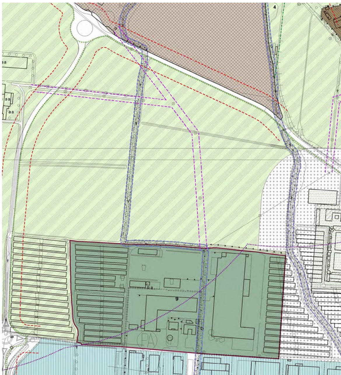
Estratto PGT Comune di Manerbio

Lo strumento urbanistico comunale infatti, che vediamo rappresentato nella tavola dell'azzonamento (PdR), prevede l'attuazione di Ambiti di Trasformazione nell'area oggetto dell'intervento.